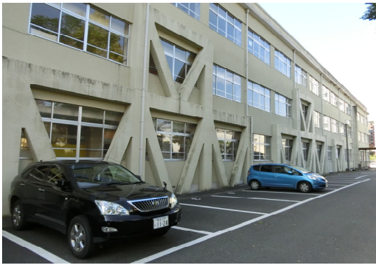
図 10 市内中心部中学校 (外付けの RC の耐震補強)

公共建築物で学校、体育館等は耐震補強がほぼ完了していました。そのお陰で学校は避難所になる事が出来ました。図 10、図 11 は築 50 年程度の中学校、小学校の耐震補強の写真です。この学校は地震後避難所として活躍しました。