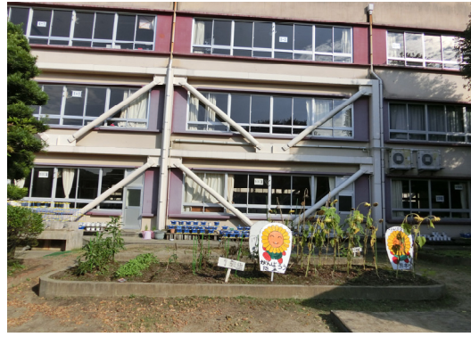
図 11 市内中心部小学校 (外付けの S 造耐震補強)

体育館、市民ホール、大形会議場等は構造体に破損はあまり見られませんでした。天井、キャットウォーク、照明設備、明り通りの天窗のガラス等に被害が見られ、避難場所になれない施設がありました。また、地盤の液状化のためライフラインが遮断され、上下水道が使用出来ないなど、当初考えて居なかった状況が起こりました。