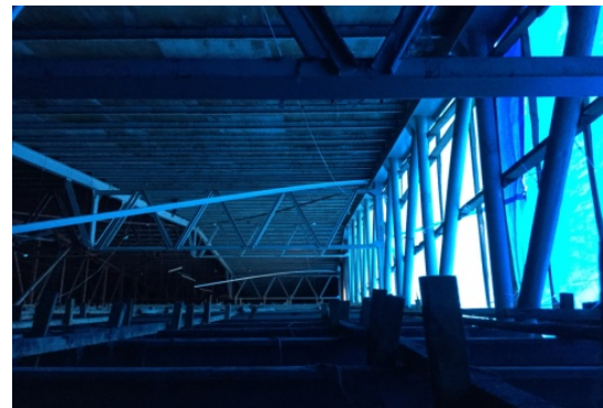
図 4 妻面の小屋ブレースのボルト破断 （図 1 の雲印部分）