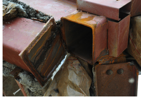
図 9 仕口部の溶接破断