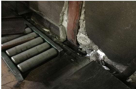
図 3 間柱の下部の座屈