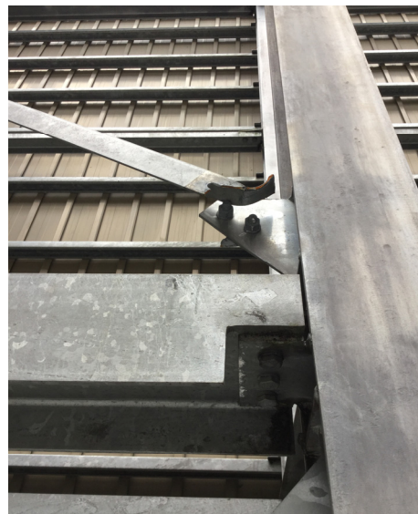
図 13 取付部のブレースの破断