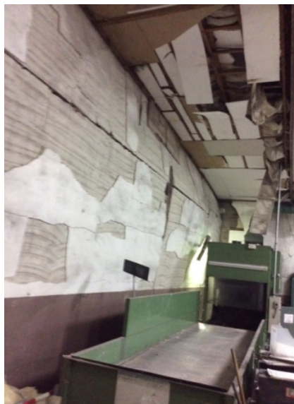
図 5 天井吊材の破断とブロック壁の損壊