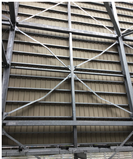
図 12 ブレースの座屈

ース側の穴が抜ける場合が多いようです。一方、古い建物では中ボルトが使われている場合が多く、その場合はボルトは剪断破断しています。