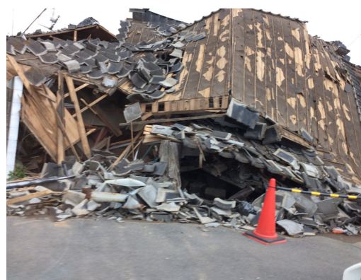
図 7 木造店舗付き住宅

次に鉄骨構造ですが、店舗付き住宅で溶接の不備による倒壊が数件見られました。この不備とは、柱（コラム）の突き合せ溶接部を片側すみ肉で溶接したものです。