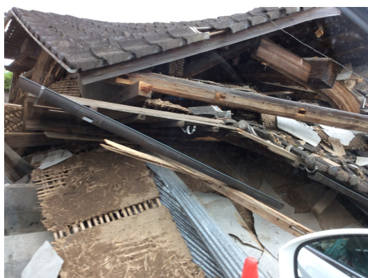
図 6 木造家屋

木造の建物で屋根の重い建物はほとんど押しつぶされた様に倒壊しています。この地区では、新耐震以前の建物で木造、コンクリート造は大きな被害を受けています。