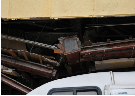
図 8 コラム柱