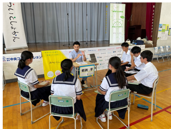
図7 「未来図書館」へ派遣した 若手・中堅社員の講義