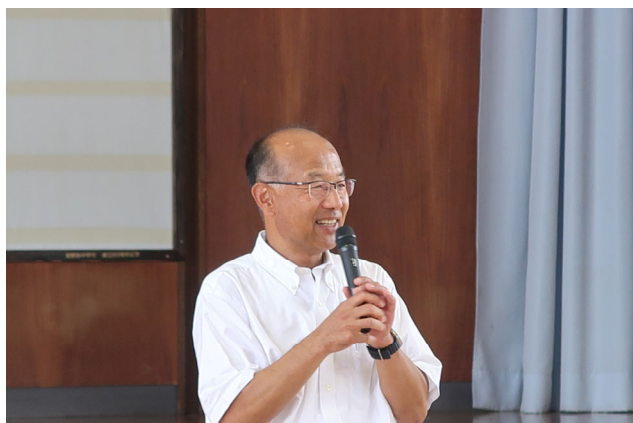
図6 「未来図書館」にて講義中の執筆者

この未来図書館との協働を、岩手県全域に展開し、岩手県各地の中学校へ、各地の溶接協会社員が社会人講師として参加し、溶接の魅力を直接中学生にピーアールしていくことを、次の戦略として検討している。うまく継続出来れば、溶接・鉄構産業へ興味をもってくれる若者が増えていくのではないかと大いに期待している。