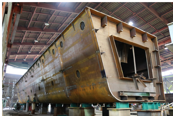
図 4 津波対策用大型水門

平成 23 年 3 月に発生した東日本大震災後の復興において、岩手県内に大型の橋梁工事、津波対策用大型水門・陸閘工事が数多く事業化され、地元企業に元請施工するチャンスを得た。津波荷重に対して設計された大断面箱桁状の扉体を有するゲート（図 4）は、運搬可能なサイズに分割、現場に運び込んで地組立を行い、形状管理を徹底して現場で全線完全溶込み溶接を行い、X 線検査を合格させた。