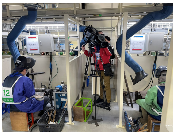
図5 岩手県高校生溶接技術競技会

これらを通じ、高校教育界と産業界の理解・交流が進んで相互の信頼が深まり、令和2年1月には、岩手県高等学校教育研究会機械専門部の主催、岩手県溶接協会が運営を担当し、岩手県高校生溶接技術競技会（図5）が開催されるに至った。その後も毎年開催され、現在に至っている。