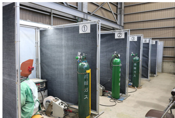
図2 社内の専用溶接練習場

あるいは両部門優勝も4度果たし、県代表として出場した全国大会でも、過去10年に18位、20位、5位、10位、12位と優良賞3回、優秀賞2回、合計5回の上位入賞を果たしている。会社の方針として、溶接技能者を尊重し、大切に処遇し、業務を通じて成長してもらって人生を豊かに過ごして欲しい、という思いが社員に伝わっているからだと思っている。