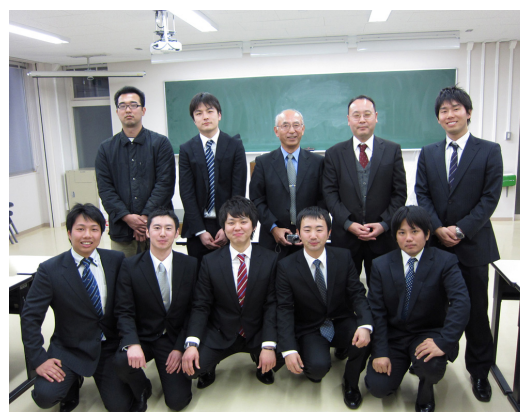
図 5 第 2 期生コース修了者