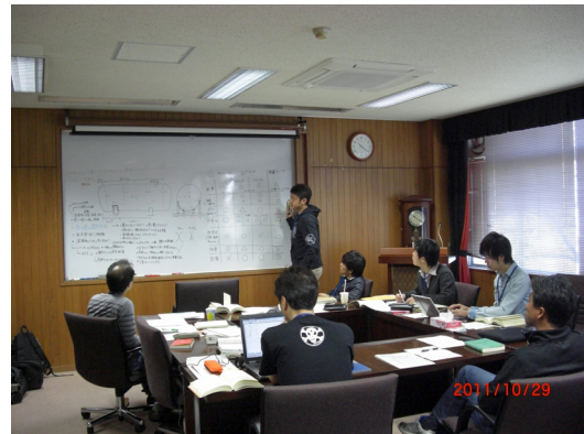
図 2 ケーススタディー風景（於：接合研）