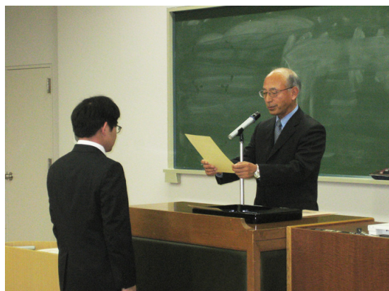
図 4 コース修了証授与式

今までの実績では、2010 年 3 月（第 1 期生）に 4 名が IWE 資格と修士学位の両方を取得して大学院を巣立ちました。これは我が国で初めてとなります。また、現在までの IWE ディプロマ資格の取得者数は表 1 に示すとおり、年々増加しています。