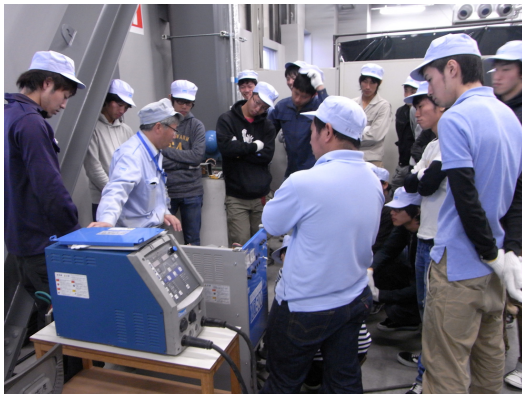
図 1 実習風景（於：ダイヘン）

特認コースを通じて IWE ディプロマ資格の取得を目指すことも可能になっています（図 3 の破線矢印を参照）。